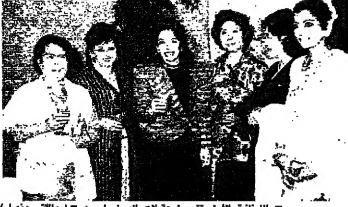
البنائيات الأثري تتوسط محاللات الدبلوماسية (الداخلي والخليج)